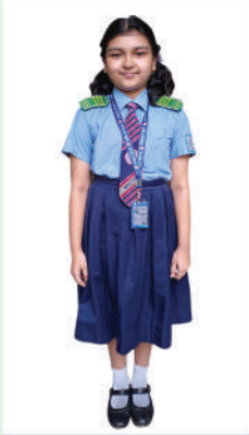
প্লে - তৃতীয়