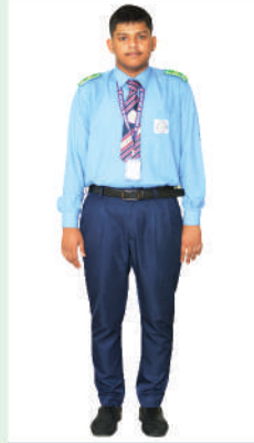
প্লে - দশম