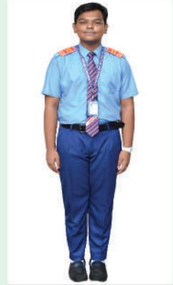
প্লে - দশম