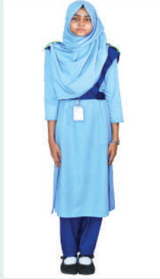
চতুর্থ - দশম